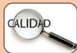
CALIDAD EN LA ATENCIÓN